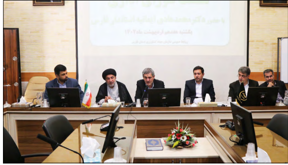
استاندار فارس تأکید کرد: