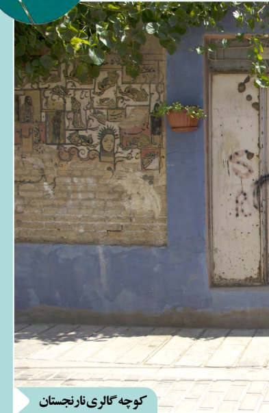
کوچه کالری نازنجان