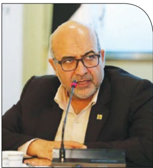
مدیرعامل شرکت شهرک‌های صنعتی فارس خبر داد: