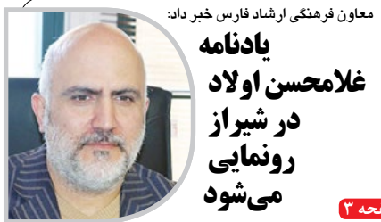
معاون فرهنگی ارشاد فارس خبر داد: