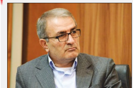
اولتیماتوم معاون استاندار فارس به گران‌فروشان

صالحی: افزایش نرخ اقلام خوراکی مانند گوشت رستوران‌ها را به مرز تعطیلی کشانده است