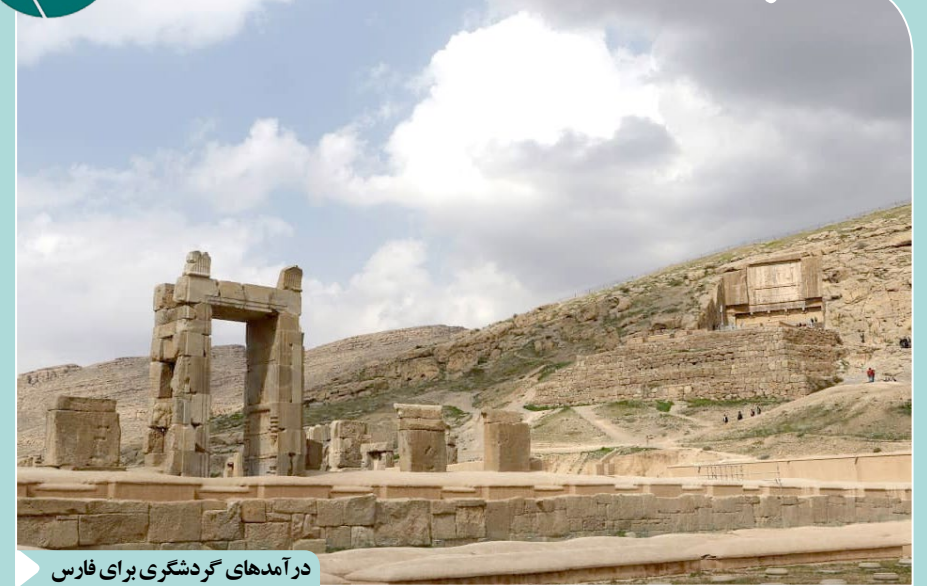
درآمدهای گردشگری برای فارس