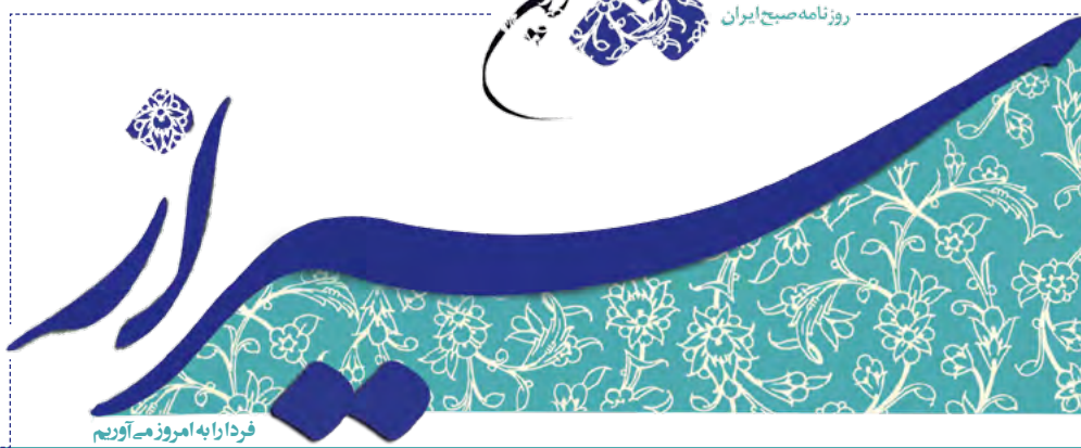
فردا را به امروز مه آوریم

و عده مهاجم سابق فجر شهید سپاسی در صورت بازگشت به این تیم: