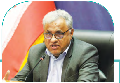
معاون عمرانی استانداری فارس: بارشها تمام استان را در بر خواهد گرفت

امام خامنه ای: مردم را با رفتار امر به تقوا کنید