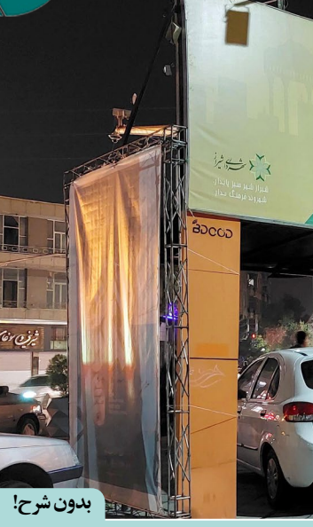
طراح و صفحه‌آرا: مریم نوذری

دبیر سرویس فرهنگ و هنر: سعیدرضا امیرآبادی