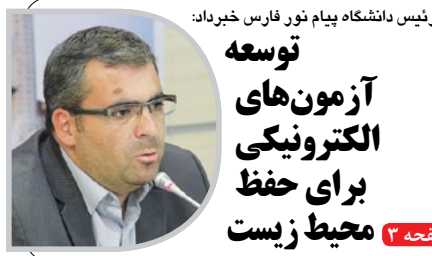
رئیس دانشگاه پیام نور فارس خیرداد: