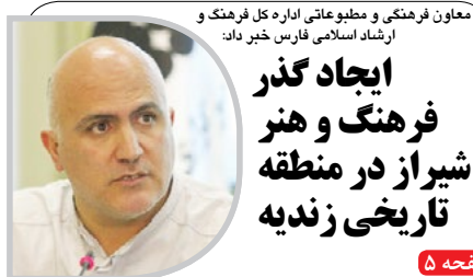
معاون فرهنگی و مطبوعاتی اداره کل فرهنگ و ارشاد اسلامی فارس خیر داد