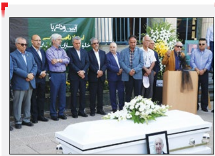
با حضور اهالی فرهنگ و هنر