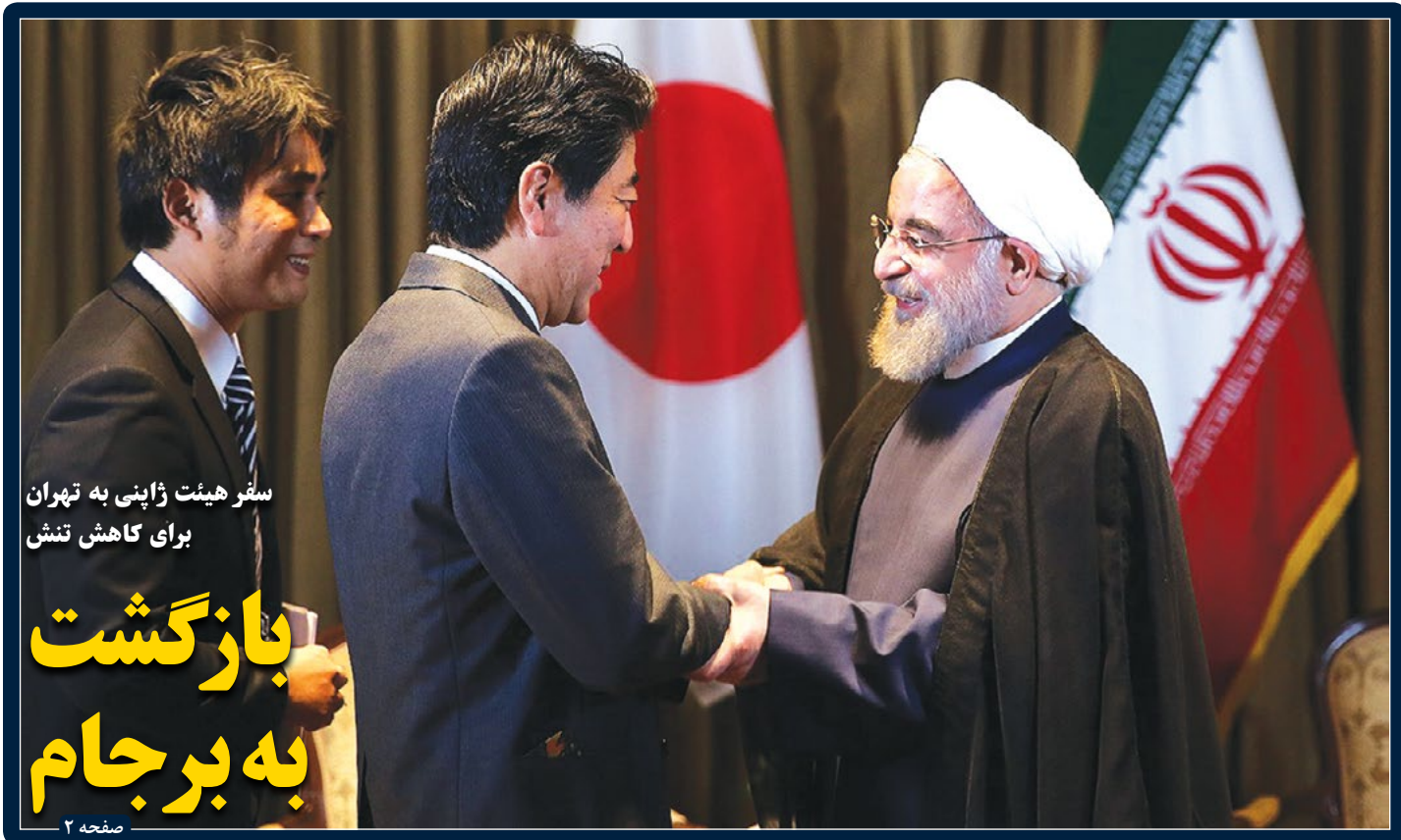
ستر هیئت ژاپنی به تهران برای کاهش تنش