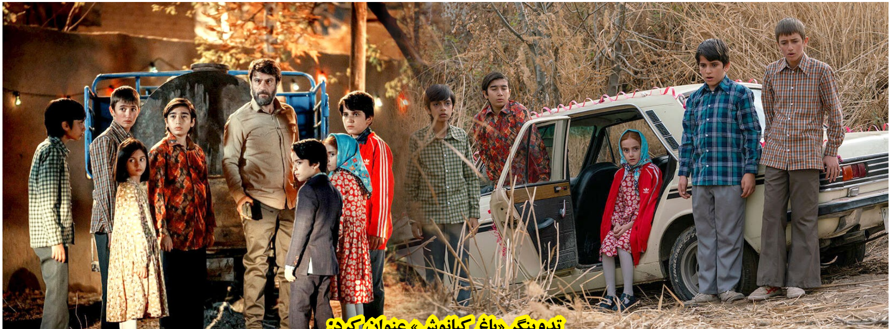
تدوینگر «باغ کیانوش» عنوان کرد:

فیلم مستند بلند «آقارضی» یکشنبه ۱۱ آذر در سینما تک خانه هنرمندان ایران به نمایش درمی‌آید. به گزارش خبرگزاری مهر به نقل از روابط عمومی خانه هنرمندان ایران، فیلم مستند بلند «آقارضی» یکشنبه ۱۱ آذر ساعت ۱۷ در سینما تک خانه هنرمندان ایران به نمایش درمی‌آید. این نشست از سلسله نشست‌های «مستندات یکشنبه» با حضور احمد مسجدجامعی قائم‌مقام مرکز دائره‌المعارف بزرگ اسلامی با همراهی تهیه‌کننده و کارگردان مستند سیدطاهر سیاح برگزار می‌شود. «آقارضی» یک فیلم مستند بلند ۹۳ دقیقه‌ای است که به موضوع سیره اجتماعی مرحوم آیت‌الله سید رضی شیرازی(ره) از علمای قدیم تهران برزاد و روایتی از ابعاد فردی، اجتماعی و سیاسی زندگی این شخصیت را به تصویر کشیده است. سیدطاهر سیاح، تهیه‌کننده و کارگردان این اثر را بر عهده دارد و عوامل دیگر ساختن این فیلم عبارت‌اند از دستیار کارگردان: مجتبی پسته، مدیر تولید: سیدمهدی فیروزآبادی، صداگذار: بهنیا یوسفی، اصلاح رنگ و نور: باران چراغی‌پور، گرافیک: مرگان سیستمی.