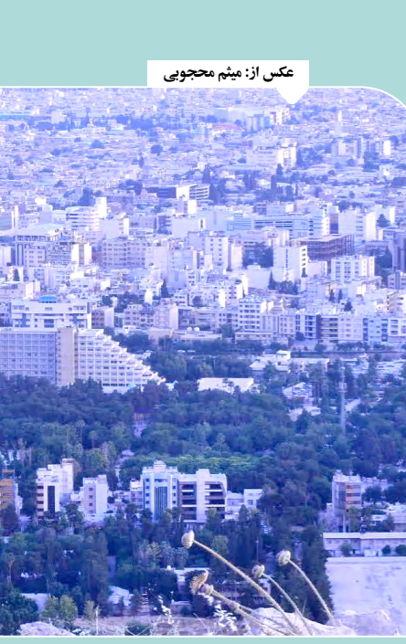
نمایی از هتل نوستالژیک شهر

کتاب جدید «بن اوکری» نویسنده برنده جایزه بوکر با محوریت فعالیت‌های محیط زیستی به نگارش درآمده و یک درخواست شخصی از بشریت برای مراقبت بهتر از کره زمین است. به گزارش ایسنا و به‌منقل از نشنال «بن اوکری» نویسنده نیجریه‌ای - بریتانیایی است که در سال ۱۹۹۱ برای رمان «جاده گمشده» به‌عنوان برنده جایزه ادبی بوکر انتخاب شد. این نویسنده هفته گذشته در جریان افتتاحیه یک رویداد ادبیی واقع در «دوبئی» از جدیدترین کتاب خود با عنوان «تایگر ورک» رونمایی کرد. «تایگر ورک» در حقیقت مجموعه‌ای از داستان‌های کوتاه، شعر و مقاله است که «اوکری» در قالب آنها تخیل و جادو را با هم درآمیخته تا عواقب ناشی از تغییرات اقلیمی را از طریق آینده‌ای روایت کند که در آن «جنگل‌ها مثل تک‌شاخ‌ها به افسانه تبدیل شده‌اند.» «اوکری» در گفت‌وگو با «نشنال» بیان کرد: «مدت‌هاست که نسبت به از دست دادن جنگل‌هایمان کنجکاو شده‌ام، چراکه دیدم این اتفاق چه بلایی بر سر سنت‌هایمان آورده است. اگر اهل قومی باشید که نیمی از مراسم‌ها و فرهنگ‌هایشان به صورت اشتراک مساعی و نوعی هارمونی با جنگل در ارتباط است، زمانی که جنگل از بین برود، مرگ چیزی در مردم کم کم آغاز می‌شود.» «اوکری» گفت که همیشه از طریق گزارش به‌طور غیرمستقیم درگیر تغییرات آب‌وهوایی بوده است.