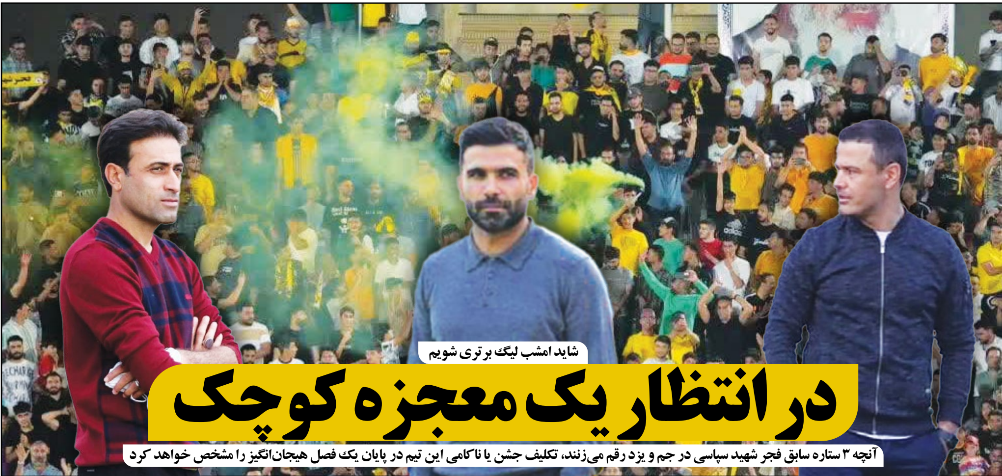
شاید امشب لیگ برتری شویم

با اعلام رسمی هلدینگ خلیج فارس، نام باشگاه استقلال تغییر نمی‌کند. به گزارش ورزش سه، از زمان واگذاری باشگاه استقلال به هلدینگ خلیج فارس، شایعات زیادی پیرامون تغییر نام باشگاه استقلال در رسانه‌ها منتشر گردیده بود و گفته می‌شد که قرار است پسوند ایران از انتهای نام رسمی باشگاه حذف شده و کلمه خلیج فارس به آن اضافه شود. این موضوع واکنش‌های مثبت و منفی زیادی را به دنبال داشت و حتی عده‌ای معتقد بودند به دلیل تشابه نام برگزاری مسابقات لیگ به نام خلیج فارس، از لحاظ حقوقی، امکان تغییر نام استقلال و استفاده از پسوند خلیج فارس وجود ندارد. حالا در جلسه مجمع عادی به‌صورت فوق‌العاده باشگاه استقلال ظهر دیروز و در محل شرکت صنایع پتروشیمی خلیج فارس برگزار گردید، این سؤال نیز مطرح گردید. در جلسه مجمع عمومی عادی استقلال و در پاسخ به سؤال یکی از اعضای مجمع درباره تغییر نام باشگاه استقلال ایران، تأکید شد که قطعاً نام استقلال برای این باشگاه حتماً باقی می‌ماند و درباره پسوند آن طی مراحل و در مجمع فوق‌العاده تصمیم‌گیری خواهد شد.