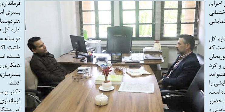
مجموعه‌ای که در دوران نه‌چندان دور، مهم‌ترین مرکز اجرای نمایش‌های فاخر در شهر شیراز بود، اکنون به ساختمان کهروق و کم‌رفت‌وآمد برای دوست‌داران هنرهای نمایشی تبدیل شده است. به گزارش پایگاه اطلاع‌رسانی و روابط عمومی اداره کل فرهنگ و ارشاد اسلامی استان فارس؛ چند سالی است که به هر جرایبی، پیرامون مجموعه فرهنگی و هنری ابوریحان بیرونی شیرازی، جایی برای خرید و فروش، استعمال و گرد آمدن معتادان و بزهکاران شده است؛ به گونه‌ای که رفت‌وآمد هنرمندان و فرهنگ‌وران به‌ویژه هنرمندان هنرهای نمایشی را با گرفتاری‌هایی همچون مزاحمت برای آنان، روبرو کرده است. اداره کل فرهنگ و ارشاد اسلامی فارس در نشستی با حضور دستگاه‌ها و نهادهای مربوطه برای برطرف کردن این ناسامانی و گرفتاری، گام برداشت؛ هرچند برخی از دستگاه‌ها و نهادهای مربوطه، در این نشست حضور نیافتند، نشست با حضور دکتر یوسف قربانی، رئیس اداره سیاسی، امنیتی و اجتماعی فرمانداری شیراز در مرکز اجرای نمایش‌های فاخر در شهر شیراز بود، اکنون به ساختمان کهروق و کم‌رفت‌وآمد برای دوست‌داران هنرهای نمایشی تبدیل شده است. موسوی‌نژادادیان خواستار سامان‌دهی زودتر پیرامون تالار ابوریحان شد و با اشاره به کمبود تماشاخانه برای ترمین و اجرای هنرهای نمایشی، ادامه داد: نیاز است تا با همراهی و همکاری

فرمانداری و شهرداری شیراز و فرماندهی انتظامی استان، بستری امن و آرام را برای بهره‌برداری هنرمندان، فرهنگ‌وران، هنردوستان و مردم فراهم کرد. معاون امور هنری و سینمایی اداره کل فرهنگ و ارشاد اسلامی فارس با اشاره به ایستایی دو ساله هنرهای نمایشی پس از همه‌گیری بیماری کرونا بیان داشت: اکنون که شرایط برای فعالیت دوباره هنرمندان فراهم شده است، همه دستگاه‌های تأثیرگذار در این حوزه باید با همکاری یکدیگر برای برطرف کردن این گرفتاری اجتماعی و بسترسازی در راستای پویایی دگربراه برای هنرمندان تلاش کنند.