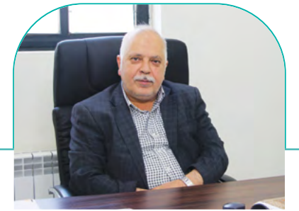
مدیر عامل مجمع خبرین شهرساز و فرهنگساز شیراز: اهدای ۱۲۵۴۴۳ جلد کتاب در سرای فرهنگ مهربانی