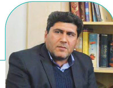
مدیر عامل شرکت آب منطقه‌ای فارس خبر داد: