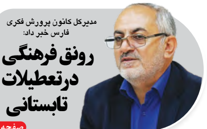
مدیر کل کانون پرورش فکری فارس خیر داد: