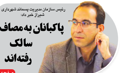
رئیس سازمان مدیریت پسماند شهرداری شیراز خیر داد: