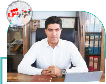
گزارش شیراز نوین از وضعیت صنعتی عمده و خرده فروشان آهن در بازار بی ثبات فارس