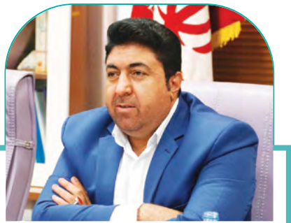
رئیس سازمان سیما، منظر و فضای سبز شهری شهرداری شیراز خیر داد: