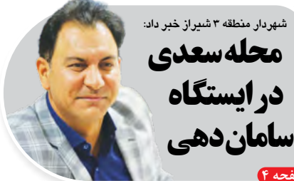
شهردار منطقه ۳ شیراز خیر داد: