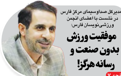
مدیرکل صداوسیما مرکز فارس در نشست با اعضای انجمن ورزشی نوسان فارس: