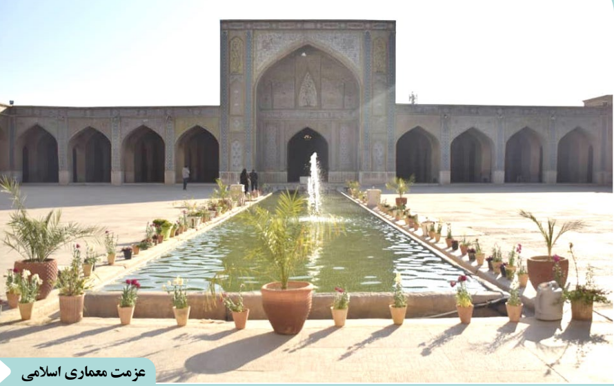
عزت معماری اسلامی