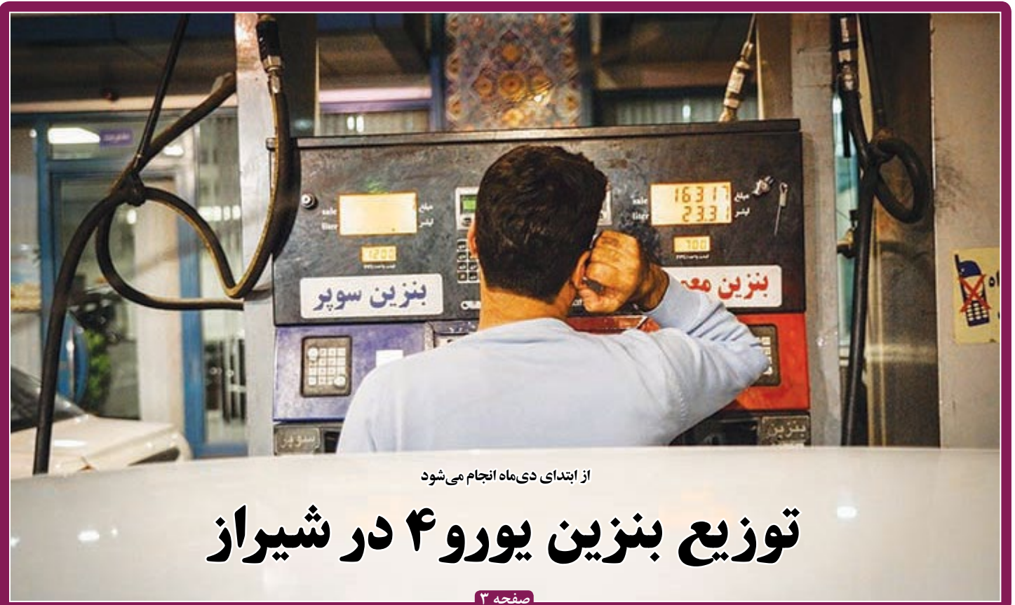
از ابتدای دی‌ماه انجام می‌شود