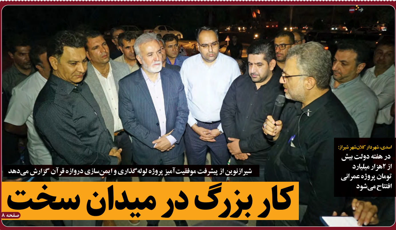
شیراز نوین از پیشرفت موفقیت آمیز پروژه لوله گذاری و ایمن سازی دروازه قرآن گزارش می دهد

قرل سفلی: ۱۲۳۵ نفر در فارس تا پایان روز چهارم ثبت نام کرده‌اند