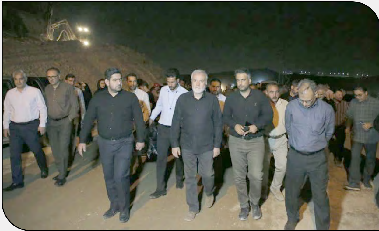
پروژه‌ها مدل مالی تعریف شد تا تمام معاونت‌های ذیل مجموعه شهرداری با اهتمام ویژه‌ای نسبت به پیشبرد اقدامات توجه داشته باشند. شهردار شیراز با بیان اینکه مسائل مالی و تأمین اعتبار در

معاون فنی و عمرانی شهرداری شیراز در خصوص بزرگراه شهید سلیمانی اظهار کرد: این بزرگراه به طول ۱۴.۵ کیلومتر بوده که قسمت‌هایی از آن در حال بهره‌برداری و قسمت‌هایی در حال احداث و عملیات اجرایی است. محمد امین، دو عامل